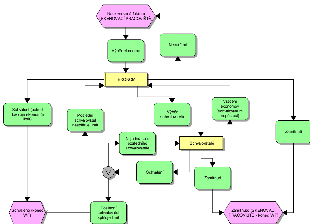
Obrázek 1: Schéma schvalovacího workflow faktur

Výchozí stav: Současný postup likvidace došlých faktur je založen na zaúčtování závazku vůči dodavateli proti spojovacímu účtu jiným druhem dokladu, než je faktura. Po schválení tohoto dokladu ve schvalovacím WF je závazek zaplacen, a na základě informací získaných ve schvalovacím WF je pořízen nový finanční doklad, který rozúčtuje náklady ze spojovacího účtu na jejich konečné příjemce - účty HK a NS, resp. pořízení majetku. Současné workflow dodavatelských faktur je vytvořeno nad přímo zaúčtovanými doklady (objektem BKPF).